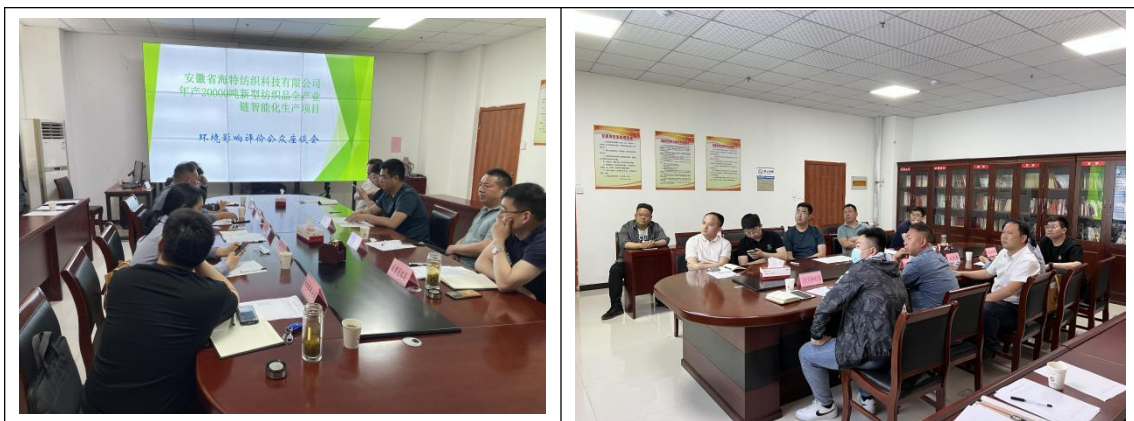
图 4-2 座谈会现场照片

2023年6月18日，安徽省海特纺织科技有限公司组织召开了公众参与座谈会，会议邀请五河县发展和改革委员会、五河县生态环境分局、五河经济开发区管理委员会、五河县城市管理局、五河县头铺镇人民政府、冯刘村村委会、冯刘村村民代表、安徽睿晟环境科技有限公司参与会议并发言。会议针对当地群众普遍关注的污染控制及环境影响等问题进行了回答解疑，公参座谈会上各代表群众均表示支持项目的建设，无人表示反对（座谈会相关材料见附件）。