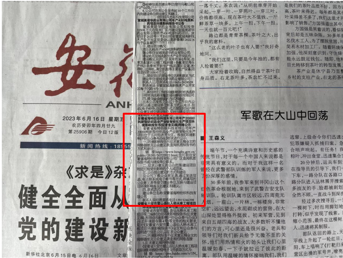
图 3-2 报纸公示截图