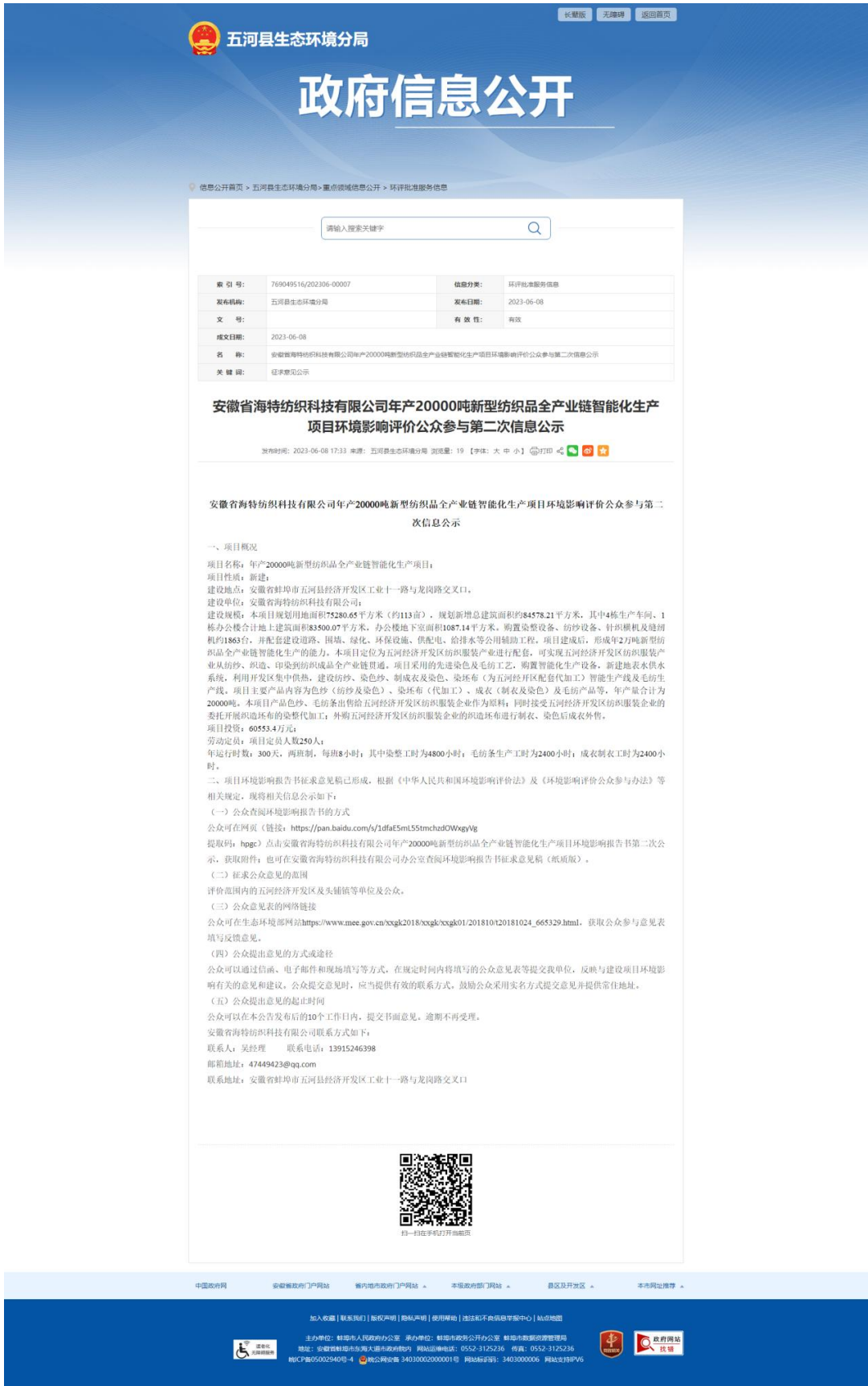
图 3-1 第二次网络公示截图